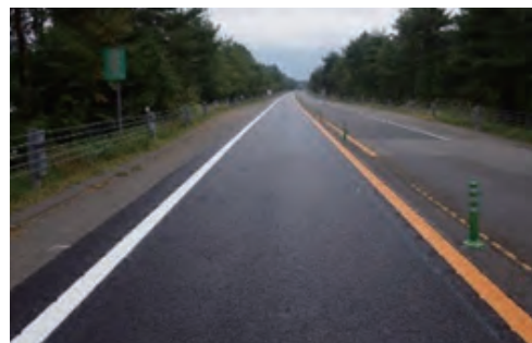
(路面補修の完成イメージ)