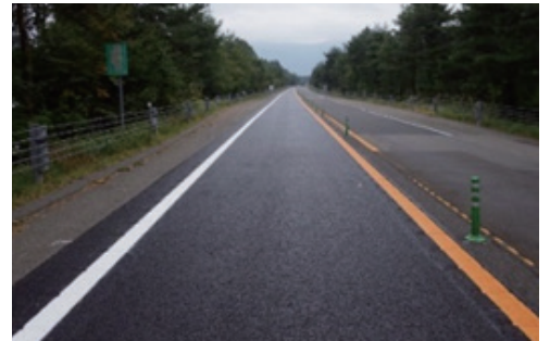
(路面補修の完成イメージ)